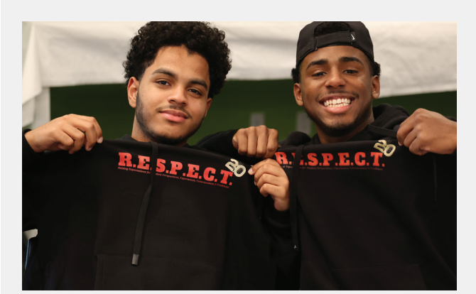
El 24 de octubre, la serie de Conferencias de Liderazgo sobre Equidad Estudiantil RESPECT 2023-24 reunió a estudiantes de las escuelas intermedias y secundarias del PPSD que fueron seleccionados por sus líderes escolares para representar a sus compañeros. Los estudiantes desarrollaron planes de acción de proyectos para fomentar la equidad en sus comunidades escolares y trabajaron en asociación con líderes adultos para implementar sus planes. Los estudiantes se reunirán nuevamente en febrero y mayo.

Las subvenciones de Fomento a la Equidad ( Equity Boost ) todavía están disponibles y están destinadas a permitir a estudiantes y educadores probar nuevas ideas e innovaciones creativas que respalden la enseñanza y el aprendizaje ejemplares, al tiempo que promueven la comprensión y apreciación cultural, los compromisos contra el racismo y la comprensión del compromiso cívico y la democracia. Las subvenciones de Fomento a la Equidad financiarán proyectos escolares entre $500 y $4900. Las solicitudes se aceptan de forma continua.